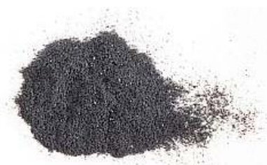
35 408 xx skleněný prášek