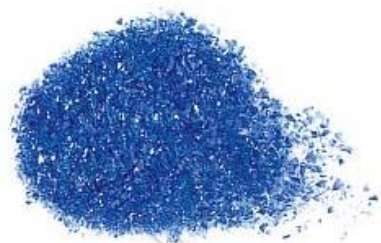
35 401 xx skleněná frit zrnitost jemná