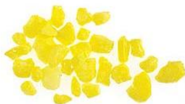
35 403 xx skleněná frit zrnitost hrubá