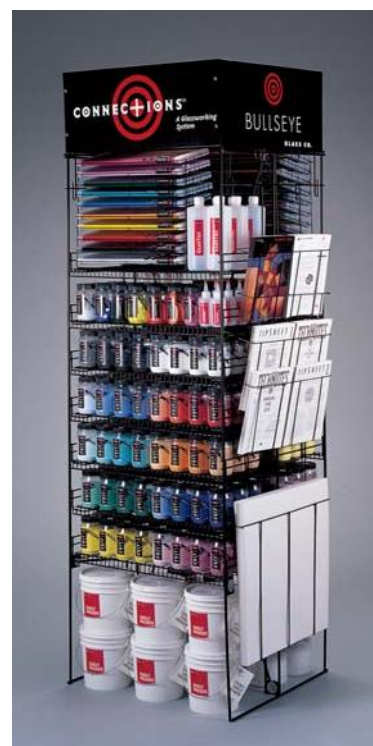
35 490 00 prodejní stojan BULLSEYE bez obsahu

Kompletní přehled frit, tyčinek a šupin, včetně balení a objednávacích katalogových čísel přináší následující tabulky.