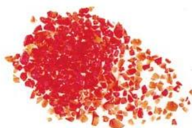
35 402 xx skleněná frit zrnitost střední