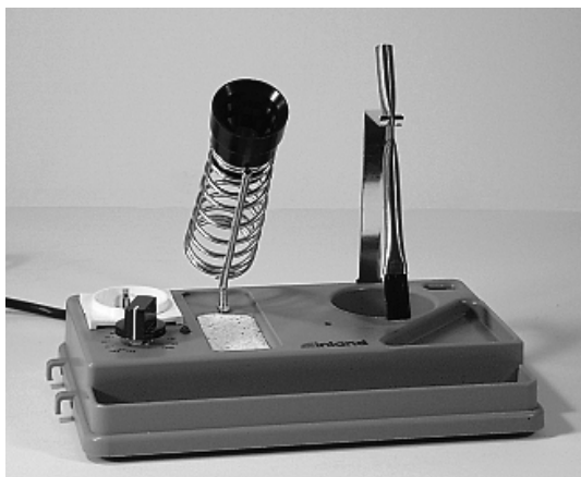
36 132 00 INLAND letovací stanice s držákem pro pájku a pro štětec, regulace teploty