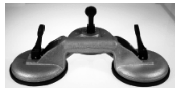
36 603 00 přísavka na manipulaci s tabulovým sklem, hliníková, tříhlavá nosnost 120 kg