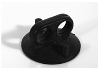
36 601 00 přísavka na manipulaci s tabulovým sklem, gumová nosnost 20 kg