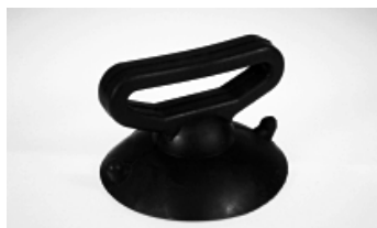
36 605 00 přísavka na manipulaci s tabulovým sklem, gumová nosnost 30 kg