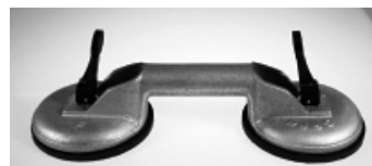
36 602 00 přísavka na manipulaci s tabulovým sklem, hliníková, dvouhlavá nosnost 70 kg