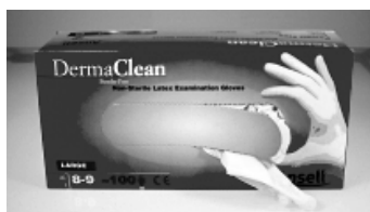
36 520 05 rukavice jednorázové velikost 8-9, latex, bílé, 50 párů