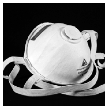
35 607 30 respirátor, P3, DIN FFP 3 s vydechovacím ventilem