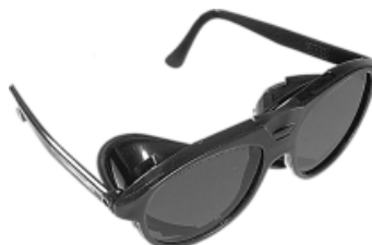
30 530 00 brýle ochranné