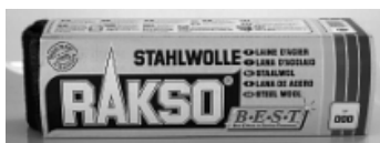
00 305 01 RAKSO ocelová vlna, 000 200 gr