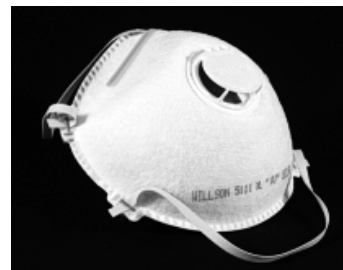
35 607 10 respirátor, P1, DIN FFP 1 s vydechovacím ventilem