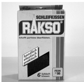
00 305 00 RAKSO ocelová vlna, 00 balení 6 x 27 g