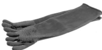
36 521 00 rukavice gumové, délka 60 cm