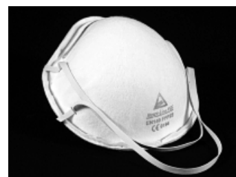
35 607 15 respirátor, P2, DIN FFP 2