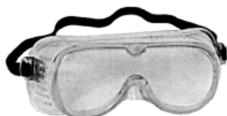
30 520 00 brýle ochranné, uzavřené