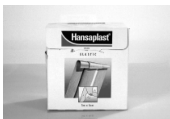
36 990 00 Hansaplast, standard, 5 m x 6 cm