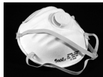
35 607 20 respirátor, P2, DIN FFP 2 s vydechovacím ventilem