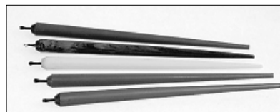
51 450 00 očko vyřezávací pro rovnoběžné řezy sada 5 ks