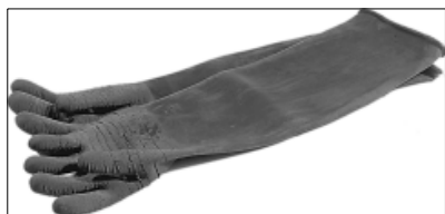
51 355 05 rukavice pískovací