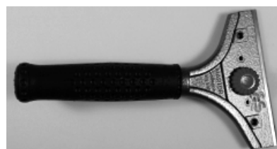
36 250 00 MARTOR škrabka na sklo "profi"