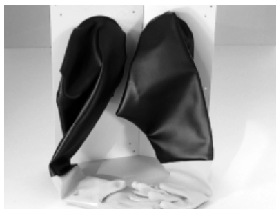
51 355 00 rukavice pískovací s montážním plechem