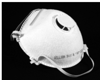
35 607 10 respirátor, P1, DIN FFP 1 s vydechovacím ventilem