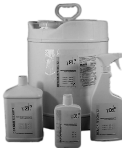
49 002 00 - 49 019 00 PROVETRO ochranný lak

49 030 00 houbička pro roztírání ochranného laku