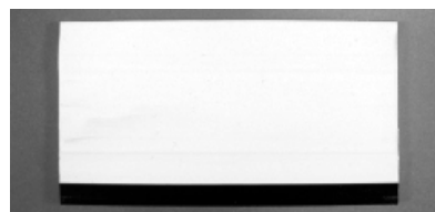
51 460 00 hladítko na pískovací fólie šířka : 10,5 cm