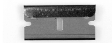
36 251 02 MARTOR škrabka na sklo