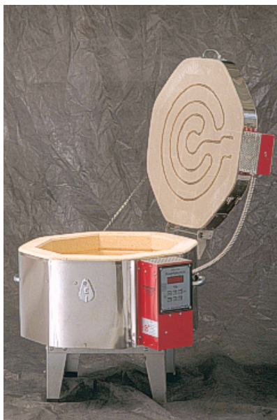
35 161 00 pec EVENHEAT GTS 23-9 s integrovaným regulátorem