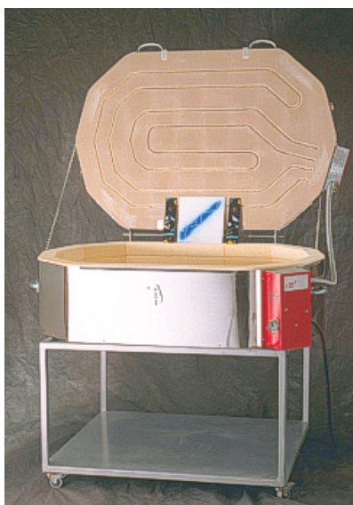
35 162 00 pec EVENHEAT GTS 2541-9