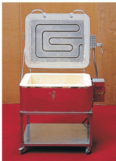
35 163 00 pec PROVETRO GT4050