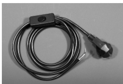
20 105 01 kabel připojovací, umělá hmota