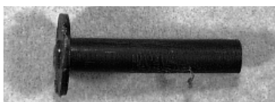
20 190 17 průchodka, umělá hmota