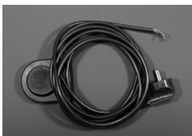
20 107 01 kabel připojovací, umělá hmota, nožní vypínač