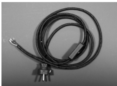
20 101 01 kabel připojovací, bavlněné opletení