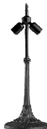
13 805 00 WILKINSON 2 V/B: 550 / 350 mm D: 200 mm