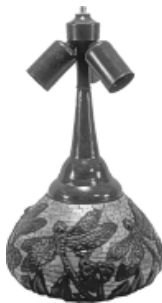
13 842 00 TIFFANY DRAGONFLY V/B: 390 / 220 mm D: 210 mm