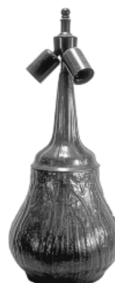
13 838 00 HANDEL 8 V/B: 520 / 300 mm D: 220 mm