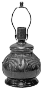
13 813 00 TIFFANY 1 V/B: 370 / 210 mm D: 150 mm