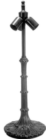
13 804 00 WILKINSON 1 V/B: 640 / 390 mm D: 210 mm