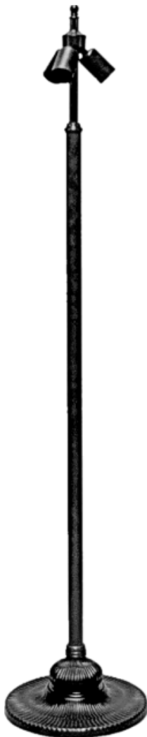
13 815 00 CLASSIC 1 V/B: 1370 / 1150 mm D: 300 mm