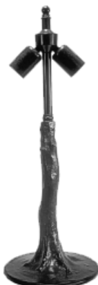
13 801 00 HANDEL 1 V/B: 540 / 330 mm D: 200 mm