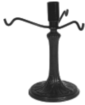
13 807 01 HANDEL 3 V/B: 260 / 150 mm D: 110 mm