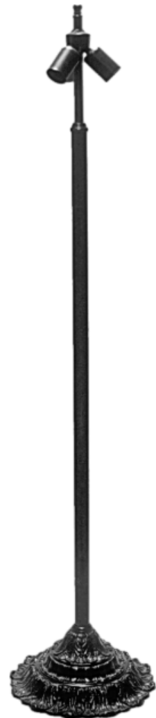
13 818 00 GENERIC 2 V/B: 1360 / 1160 mm D: 300 mm