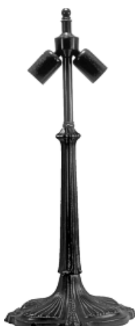
13 811 00 MILLER 1 V/B: 600 / 360 mm D: 245 mm