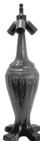
13 837 00 HANDEL 7 V/B: 620 / 350 mm D: 210 mm