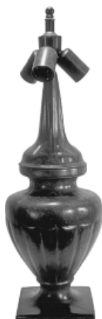
13 836 00 HANDEL 6 V/B: 590 / 350 mm D: 160 mm