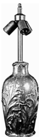
13 812 00 BRADLEY & HUBBARD 2 V/B: 610 / 360 mm D: 140 mm