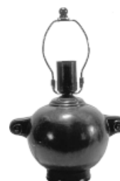
13 803 00 HANDEL 2 V/B: 330 / 170 mm D: 100 mm