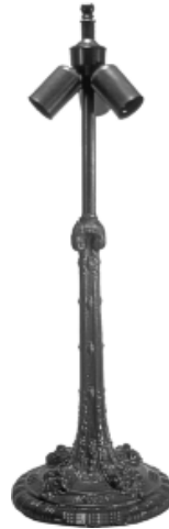
13 806 00 WILKINSON 3 V/B: 630 / 350 mm D: 220 mm