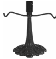
13 825 00 HANDEL 8 V/B: 260 / 150 mm D: 110 mm