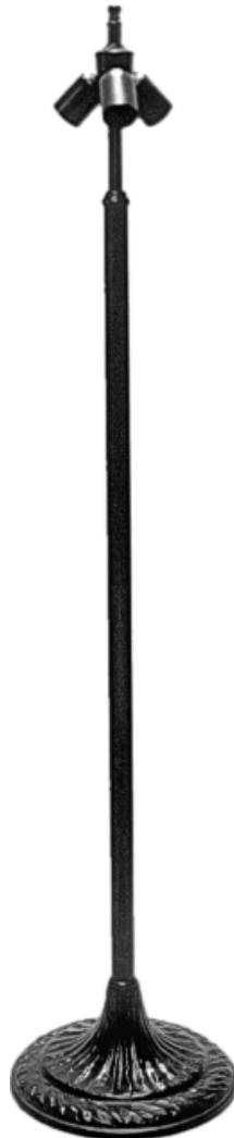
13 816 00 CLASSIC 2 V/B: 1380 / 1170 mm D: 300 mm