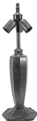
13 839 00 HANDEL 9 V/B: 550 / 370 mm D: 175 mm