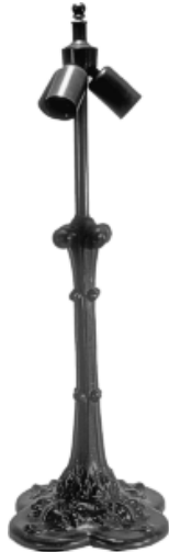
13 802 00 DUFFNER & KIMBERLEY V/B: 660 / 410 mm D: 230 mm