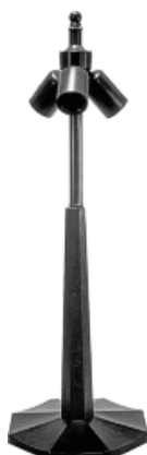
13 870 00 GENERIC 3 V/B: 540 / 340 mm D: 210 mm